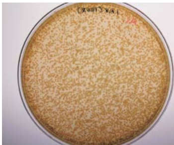
未使用抑菌成分 P-statin (褐黃色點狀即口腔細菌菌落)

2. 特殊口腔細菌抑制能力： 牙菌是造成齲齒生成、牙齦發炎的主要因素；根據研究指出：1 毫克的牙垢中就約有10 億個牙菌存在，主要為變形鏈球菌或血型鏈球菌等，只要能降低口腔中牙菌的數量，就可有效降低齲齒及牙周病的發生機率，並可改善口腔異味。